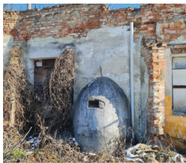
Stav v súčasnosti.