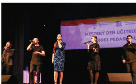
Na podujatí Mestský deň učiteľov sa tešila veľkému úspechu bratislavská FOR YOU ACAPELLA. Na festivale UDVart vystúpili hudobné skupiny CHEAP TOBACCO z Poľska a na rusínsku ľudovú hudbu nadväzujúca ČENDEŠ. Program minuloročných Palóckych dní spestrilo úspešné vystúpenie formácie PETER BIČ Project.