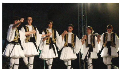
V rámci Medzinárodného Novohradského folklórneho festivalu nás navštívili dve zahraničné skupiny: Mladost z Bosny a Hercegoviny a Laografiki z Grécka.