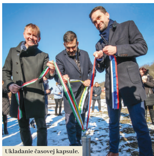
Ukladanie časovej kapsule.