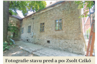
Fotografie stavu pred a po: Zsolt Czíkó

obnove podieľa ako dobrovoľný majster murár od jej začiatku.