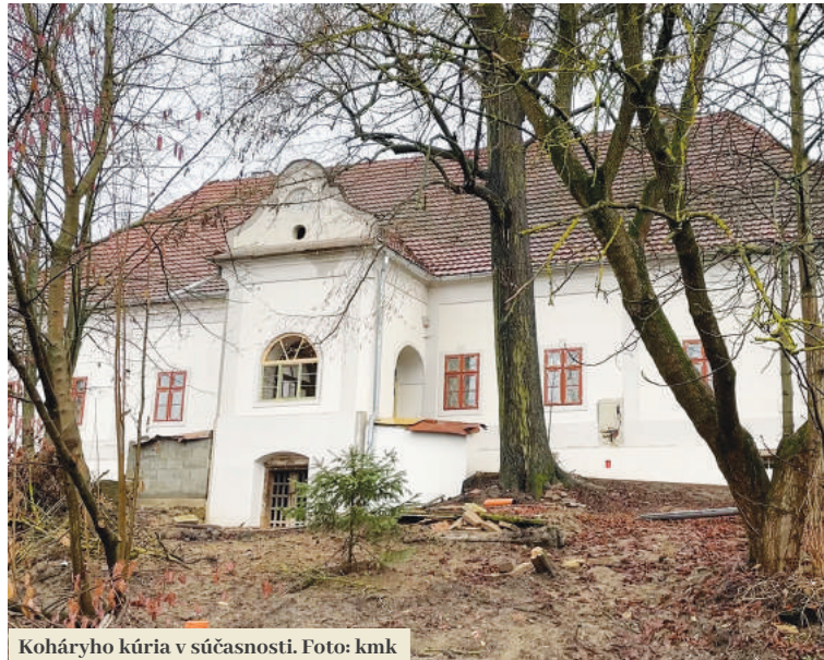
Koháryho kúria v súčasnosti.

V tom čase už bola kúria v úplne schátranom stave. Darovaná polovica budovy mala výrazne poškodenú strechu, preto sa partia mladíkov pustila do jej opravy. Po záchrane strechy pokračovali obnovou dvoch miestností v interiéru, ktoré mali slúžiť na stretnutia zboru. Už vtedy však partia dobrovoľníkov vedela, že pri tom neostanú a v záchrane historickej budovy budú pokračovať. „Smiali sa nám a pozerali sa na nás ako na bláznov. Boli sme mladí, mali sme okolo dvadsiatky. Ľudia nám neverili a mysleli si, že zlyháme. My sme sa však do projektu pustili s odhodlaním, láskou a úctou k odkazu a majetku posledného kapitána filakovského hradu,“ povedal Nagy, ktorý sa na