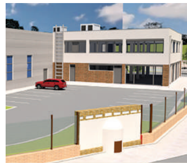
Vizualizácia stavu po dokončení.

Ako ďalej doplnil, počas prieskumu fiľakovských bunkrov narazili