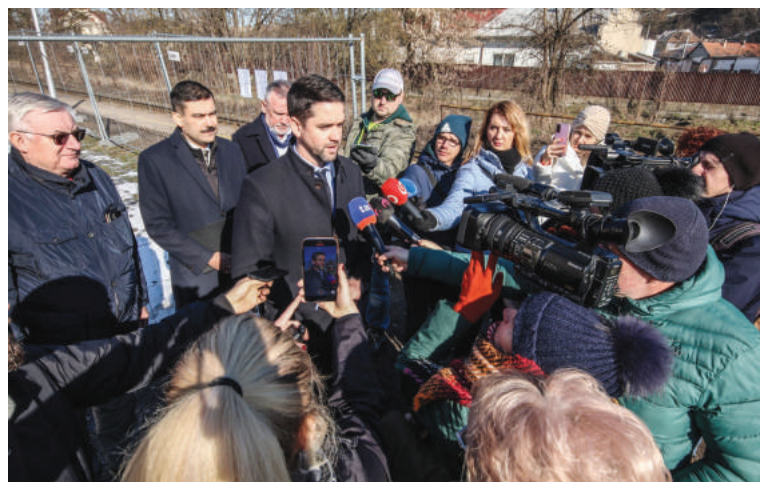
Primátor a župan spoločne zaslali otvorený list ministrom.